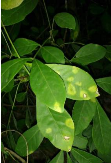
Limoncillo (Q. Roo)